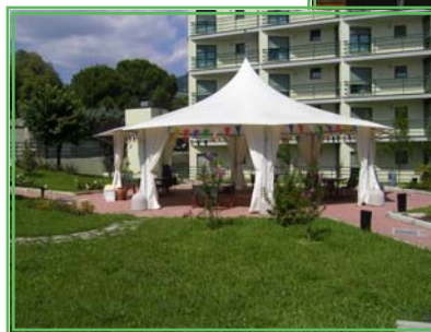
Il giardino interno